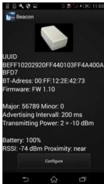
Anzeige Beacon Parameter