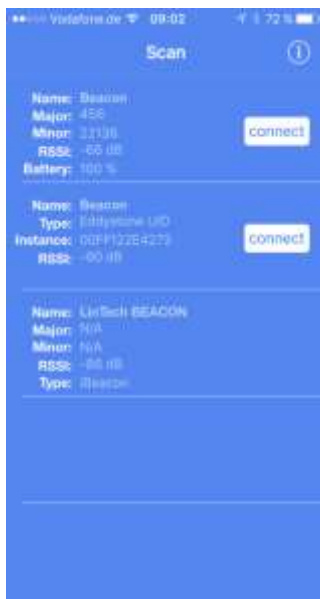
Scannen nach Beacons IOS