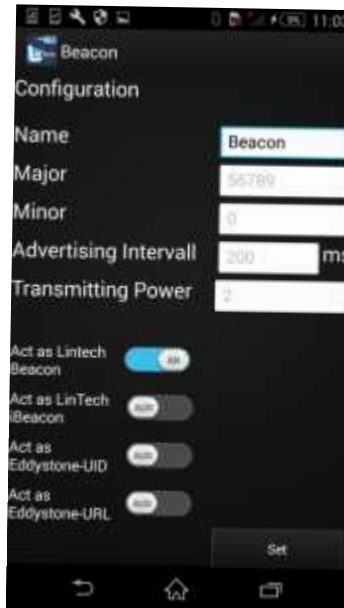
Android App gefundene Beacons