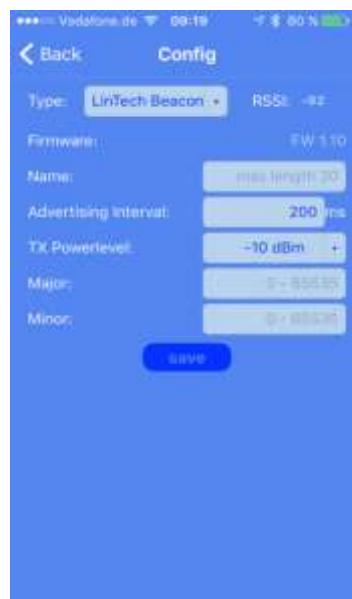
Konfiguration über IOS App

Über „connect“ kann man sich zur Konfiguration mit dem Beacon verbinden und kommt ins Konfigurationsmenü. Das Konfigurations-Fenster wird mit „Save“ wieder verlassen.